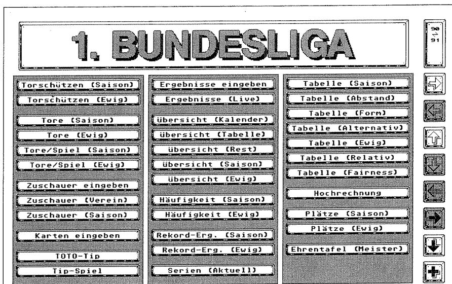
Abb. 1: Der Funktionsumfang von 'Das Fußball-Studio' läßt sich nur auf einer Menü-Seite unterbringen.

Eine andere interessante Funktion zeigt alle erreichten Tabellenplätze eines Teams während einer Saison als Fieberkurve an. Hier kann man sich einen Überblick verschaffen, wie die jeweilige Mannschaft sich